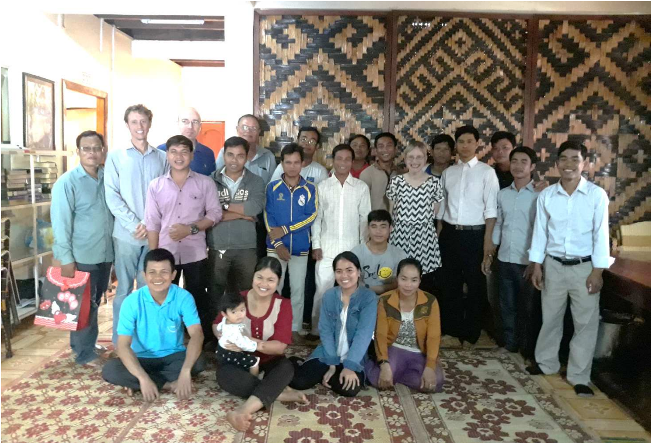
ICC-iBCDE hankkeen työntekijöitä läksiäisissä.